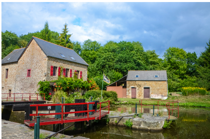
Casa de Boutron en Calorguen

El turismo fluvial también ha inspirado la renovación de estos espacios. Las casas de escluseros de Tréblavet, de Bouessay y de Les Gorsêts se han transformado en pequeños negocios locales que organizan excursiones fluviales por los canales de Bretaña. Una fantástica manera de conocer y descubrir este fascinante corredor natural a bordo de embarcaciones de pesca tradicionales.