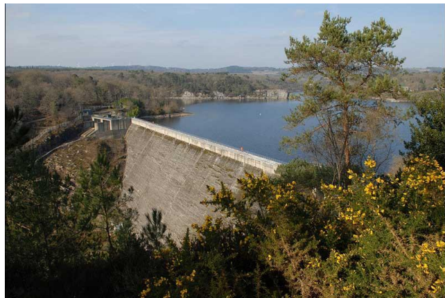
De stuwdam in het meer van Guerlédan

Het meer van Guerlédan is gevormd door de bouw van een stuwdam en waterkrachtcentrale en is een waar paradijs voor liefhebbers van buitensporten. De laatste keer dat het meer werd drooggelegd was in 1985. Meer dan 2 miljoen bezoekers kwamen toen naar Guerlédan om de geheimen van de verborgen vallei te ontdekken. In 2015 staat een nieuwe drooglegging op het programma. Het drooggelegde meer wordt dan onderworpen aan veiligheidscontroles en onderhoud.